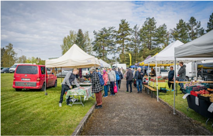
Pikaaegsete traditsioonidega Varstu kevadlaadal saab kaubelda aia- ja tööstuskaupade, käsitöö ning toiduga.