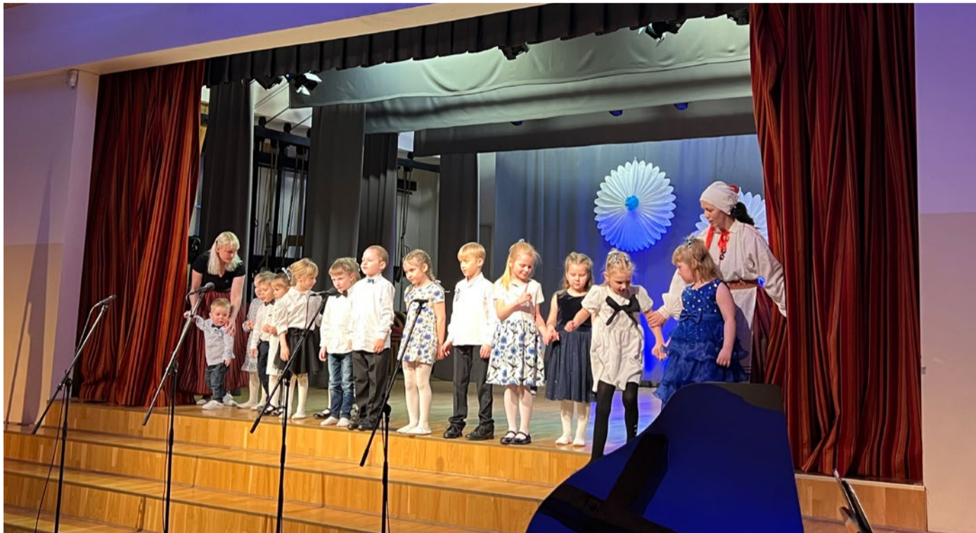
Laulma hakkavad lasteaias suured ja väikesed.